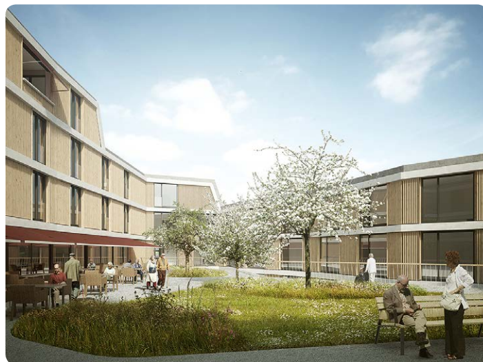
Innenhof im Domicil Weiermatt

Im April wird das beliebte Alterszentrum Domicil Spitalackerpark im Berner Breitenrain-Quartier wiedereröffnet. Die beiden neuen Gebäude bieten 69 Wohnungen und eine Pflegeabteilung mit 48 Einzelzimmern. Machen Sie sich selber ein Bild der neuen Räumlichkeiten: Wir laden Sie herzlich zum Tag der offenen Tür am Samstag, 6. April 2019, ein.