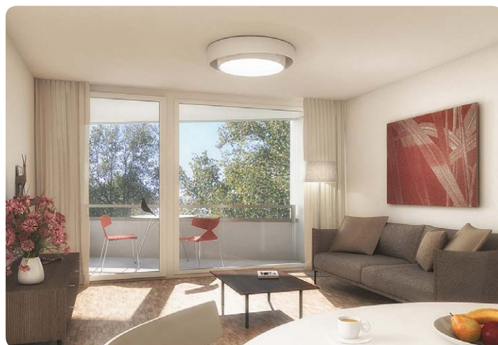
Wohnung im Domicil Spitalackerpark

Wünschen Sie weitere Informationen? Bestellen Sie noch heute die Vermietungsunterlagen. Das Domicil Infocenter ist während der Bürozeiten für Sie da.