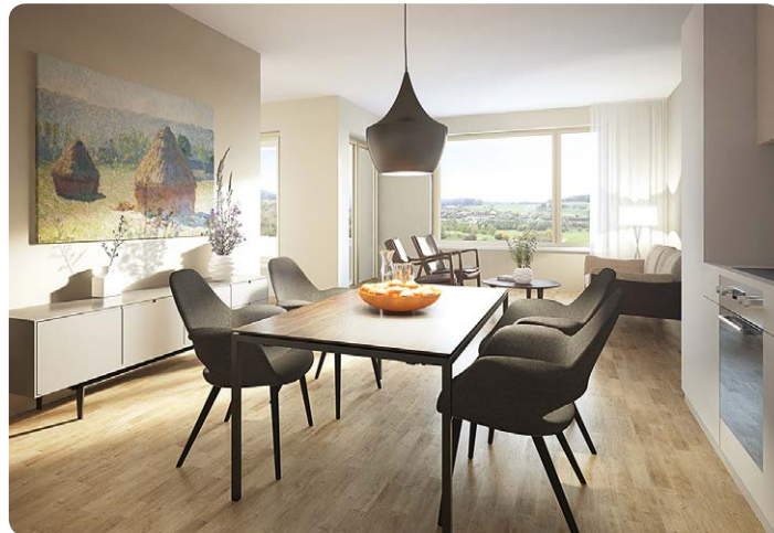
Wohnung im Domicil Weiermatt

Die Wohnungen sind ab Frühling 2019 bezugsbereit. Melden Sie Ihr Interesse schon heute im Domicil Infocenter an und sichern Sie sich eine der begehrten Wohnungen.