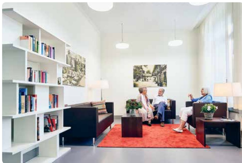
Man fühlt sich hier zu Hause

Das Domicil-Konzept ist ein wichtiger Schritt – auch in die Zukunft. ■ ab