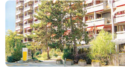
Domicil Wyler Wylerringstrasse 58, 3014 Bern Tel. 031 337 44 44, Fax 031 337 44 55 wyler@domicilbern.ch www.wyler.domicilbern.ch