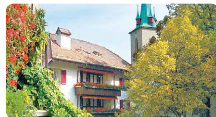
Domicil Nydegg Nydeggstalden 9, 3011 Bern Tel. 031 311 63 83, Fax 031 311 63 17 nydegg@domicilbern.ch www.nydegg.domicilbern.ch