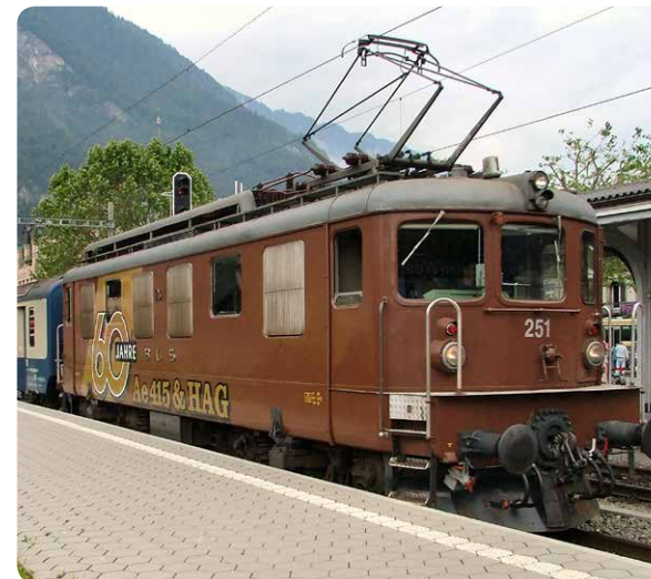
Mit den Lokomotiven AE 4/4 (Bild), AE 6/8 und der CE 4/6 ist Rudolf Pauli am liebsten gefahren.

die kurze Strecke musste ich alles selber machen – heizen und fahren». Ein Leben für und mit der Bahn begann.