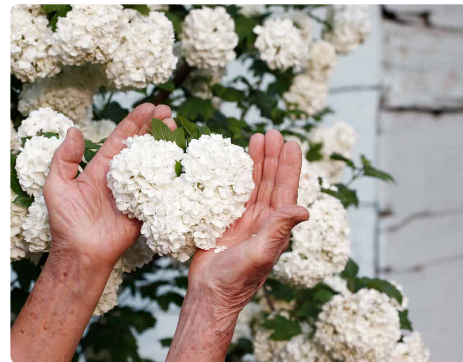
Elisabeth R. ist glücklich mit dem geschenkten Leben

*Elisabeth R., fiktive Person. Die Situation entspricht jedoch der Realität vieler Schlaganfallpatienten.