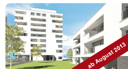
Domicil Selve Park Scheibenstrasse 33, 3600 Thun Tel. 033 224 06 00, Fax 033 224 06 01 selvepark@domicilbern.ch www.selvepark.domicilbern.ch