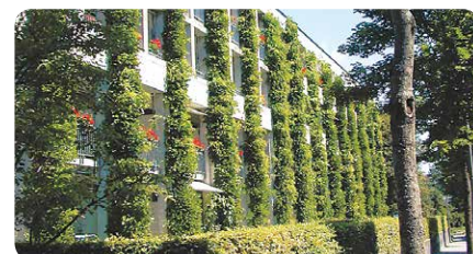
Domicil Steigerhubel Steigerhubelstrasse 71, 3008 Bern Tel. 031 380 16 16, Fax 031 380 16 00 steigerhubel@domicilbern.ch www.steigerhubel.domicilbern.ch