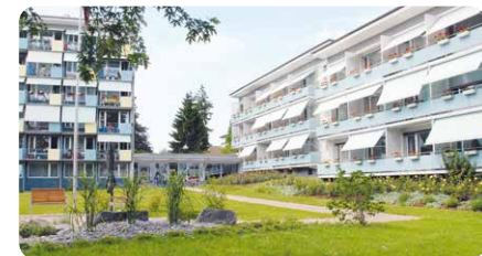
Domicil Egelmoos Bürglenstrasse 2, 3006 Bern Tel. 031 352 30 00, Fax 031 352 60 71 egelmoos@domicilbern.ch www.egelmoos.domicilbern.ch