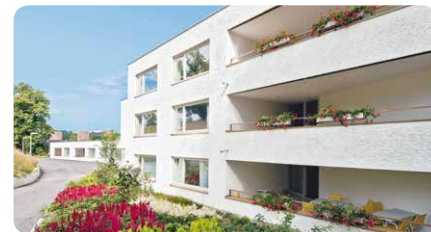
Domicil Lentulus Monreposweg 27, 3008 Bern Tel. 031 560 68 48, Fax 031 560 68 49 lentulus@domicilbern.ch www.lentulus.domicilbern.ch