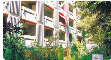
Domicil Ahornweg mit Wohngemeinschaft Mon Repos Ahornweg 6, 3012 Bern Tel. 031 300 39 39, Fax 031 300 39 31 ahornweg@domicilbern.ch www.ahornweg.domicilbern.ch