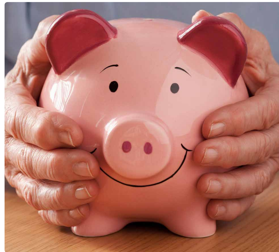
Pflegebedürftigkeit kann man sich leisten

Der Bericht zur Alterspolitik im Kanton Bern 2011 sowie Adressen und Verzeichnisse können bezogen werden: Gesundheits- und Fürsorgedirektion des Kantons Bern, Alters- und Behindertenamt, Rathausgasse 1, 3011 Bern, oder im Internet unter www.gef.be.ch