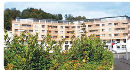
Domicil Hausmatte Dorfstrasse 1, 3032 Hinterkappelen Tel. 031 560 17 00, Fax 031 560 17 01 hausmatte@domicilbern.ch www.hausmatte.domicilbern.ch