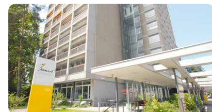
Domicil Schwabgut Normannenstrasse 1, 3018 Bern Tel. 031 997 77 77, Fax 031 997 77 78 schwabgut@domicilbern.ch www.schwabgut.domicilbern.ch