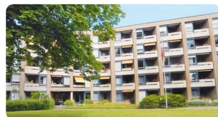
Domicil Spitalackerpark Beundenfeldstrasse 26, 3013 Bern Tel. 031 560 13 00, Fax 031 560 13 09 spitalackerpark@domicilbern.ch www.spitalackerpark.domicilbern.ch