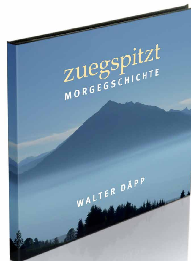
«zuegspitzt – Morgeschichte», geschrieben und gelesen von Walter Däpp, mit Musik von Ronny Kummer. Zwei CDs. Zytglogge Verlag 2013.

Schmerzlos. Angstfrei. Erfüllt. Nicht allein – umgeben von Menschen, die mir im Leben nahe gewesen sind. Und zuversichtlich.