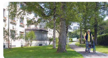
Domicil Schöneegg Seftigenstrasse 111, 3007 Bern Tel. 031 370 95 00, Fax 031 370 95 09 schoenegg@domicilbern.ch www.schoenegg.domicilbern.ch