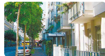
Domicil Mon Bijou Mattenhofstrasse 4, 3007 Bern Tel. 031 384 30 30, Fax 031 384 30 20 monbijou@domicilbern.ch www.monbijou.domicilbern.ch