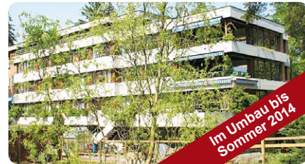
Domicil Alexandra Alexandraweg 22, 3006 Bern Tel. 031 350 81 11, Fax 031 350 81 71 alexandra@domicilbern.ch www.alexandra.domicilbern.ch Bis 2014 im Domicil Galactina Park, Belp