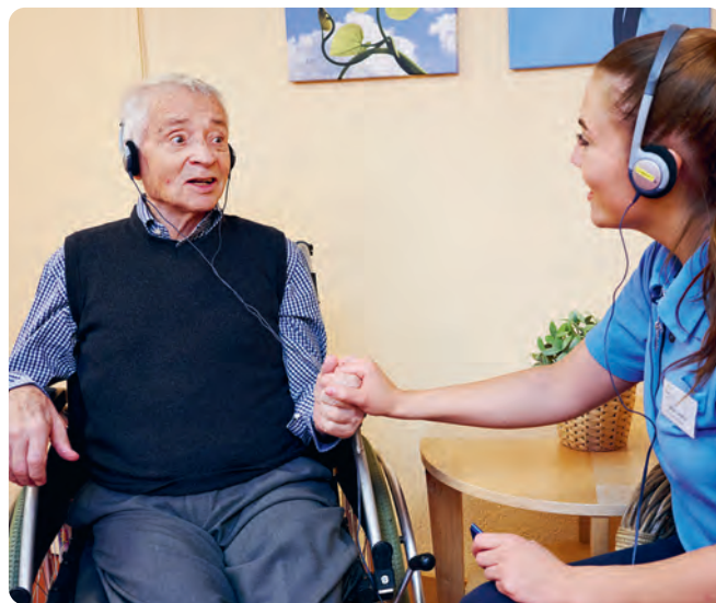
Unmittelbare, sicht- und spürbare Reaktion auf die Behandlung mit der persönlichen Musik – ein Bewohner des Domicil Kompetenzzentrum Demenz Bethlehemacker beim Einsatz von Incanto.

sen auf der Hand, dass die Wissenschaft diesen Aspekt lange Zeit nicht intensiv erforscht hat. 3 Bereits vor der Geburt beginnen Geräusche und Klänge auf den Menschen zu wirken, und Untersuchungen zeigen, dass nicht nur die Stimme der Mutter, sondern auch weitere Höreindrücke Einfluss auf Stimmung und Verhalten des Babys haben. So führen beispielsweise während der Schwangerschaft regelmässig gehörte und mit Entspannung verbundene Lieder auch nach der Geburt beim Neugeborenen zu Entspannungsreaktionen. 4 Dieser Effekt der Förderung der Entspannung oder auch der Reduktion von Stress kann über das ganze Leben beobachtet werden und geschieht unter anderem durch Erinnerungen, die ein bestimmtes Lied bei einem bestimmten Menschen aufgrund seiner Vorerfahrungen hervorrufen kann. Dabei werden nebst der Aktivierung des Belohnungssystems im Gehirn auch die Stress-Systeme herunterreguliert. 5