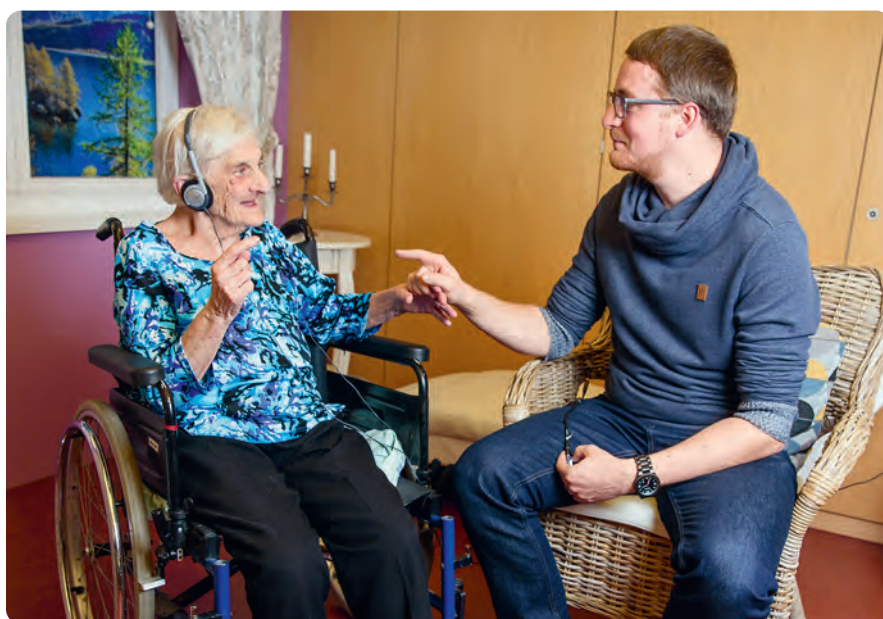
Der gezielte Einsatz von personalisierter Musik beflügelt sowohl Betroffene als auch Angehörige und Betreuende.

Aus der Anwendung von personalisierter Musik ist bei Domicil die Begeisterung aufgrund der gemachten Erfahrungen stetig gewachsen. Daraus hat sich die Überzeugung entwickelt, das erarbeitete Wissen in eigene Qualitätsstandards zu formen und dadurch weitergeben zu können. Entstanden ist die Fachstelle Incanto und ein Betreuungskonzept, das zugleich simpel in der Anwendung und stark in der Wirkung ist: Incanto.