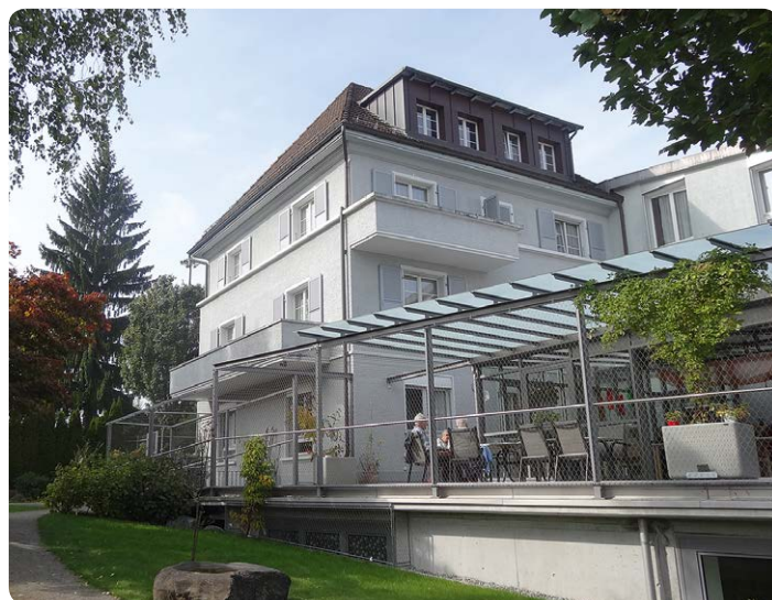
Domicil Kompetenzzentrum Demenz Serena

Domicil Kompetenzzentrum Demenz Serena Solothurnstrasse 26 | 3322 Urtenen Schönbühl Tel. 031 858 15 15 | serena@domicilbern.ch serena.domicilbern.ch