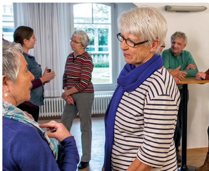
Forum Bern 60plus

Unsere Beraterinnen freuen sich auf Ihren Besuch.