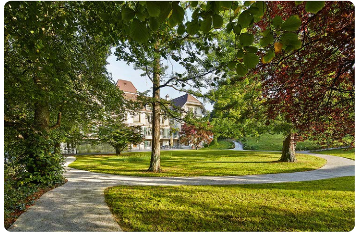
Grosszügig angelegte Aussenbereiche bieten Raum für Spaziergänge und Aktivitäten.

Domicil Kompetenzzentrum Demenz mit fünf Standorten bietet Menschen mit einer mittleren bis schweren Demenz ein sicheres und familiäres Zuhause. Je nach Bedürfnis finden Menschen mit Demenz bei uns Raum für Bewegung und eine Umgebung, in der sie mit allen Sinnen die Natur erleben können. Ebenso legen wir Wert darauf, eine Atmosphäre für emotionale Erlebnisse zu schaffen. Unsere Fachpersonen aus Pflege und Betreuung begegnen Menschen mit Demenz und ihren Angehörigen mit viel Einfühlungsvermögen und Würde. Erfahrung, Kompetenz und Professionalität zeichnen uns aus.