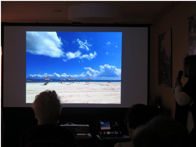
Bilder-Reise nach Mallorca