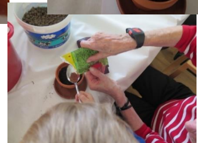
Besuch der Kita