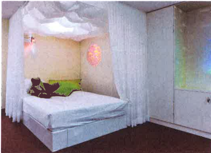
Abbildung 2: Wasserbett mit Lichtmuster, Sinnesoase des Wohnbereichs im 2. Stock