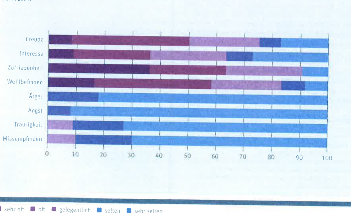
Abbildung 3: Während der Techniknutzung von den Angehörigen beobachtete Emotionen zum ersten Untersuchungszeitpunkt in Prozent

Die Angehörigen bewerten das Technikangebot zur sensorischen Stimulation überwiegend positiv. Wie häufig sie das Angebot zusammen mit den Bewohnenden nutzen, hängt stark vom Gesundheitszustand und der Mobilität der Personen ab. Sind die Bewohnenden mobil und gesundheitlich dazu in der Lage, verlassen die Angehörigen bei ihren Besuchen zusammen mit den Bewohnerinnen und Bewohnern häufig das Haus, gehen auf Spaziergänge im hauseigenen Garten oder ausserhalb und machen Ausflüge.