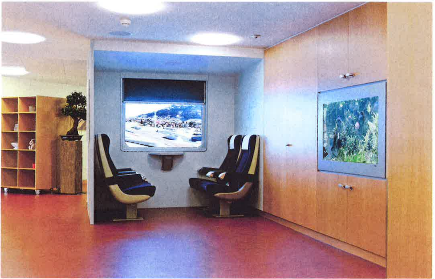
Abbildung 1: Zugabteil mit BLS 1.-Klasse-Sitzen